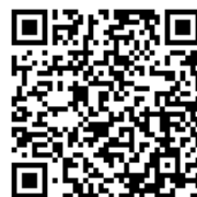
冬の小学生スポレク体験 & 親子クライミング体験講座 QRコード

※メールアドレスをお持ちでない方は、職員が代理で登録も可能ですのでご連絡ください。(事務手数料が220円別途かかります)